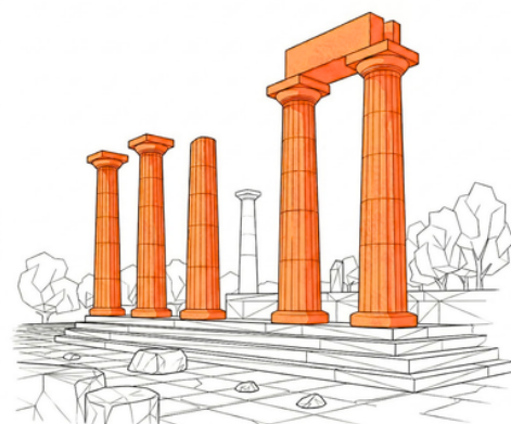
PARCO ARCHEOLOGICO DI RUDIAE