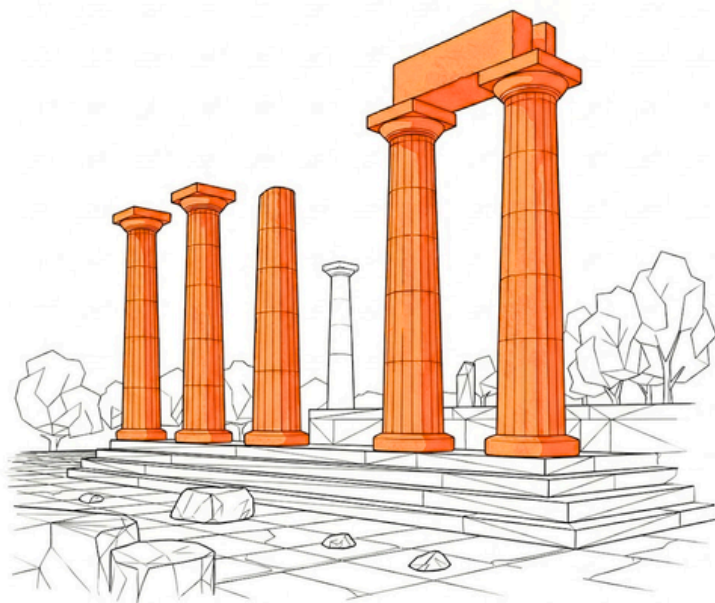
PARCO ARCHEOLOGICO DI RUDIAE