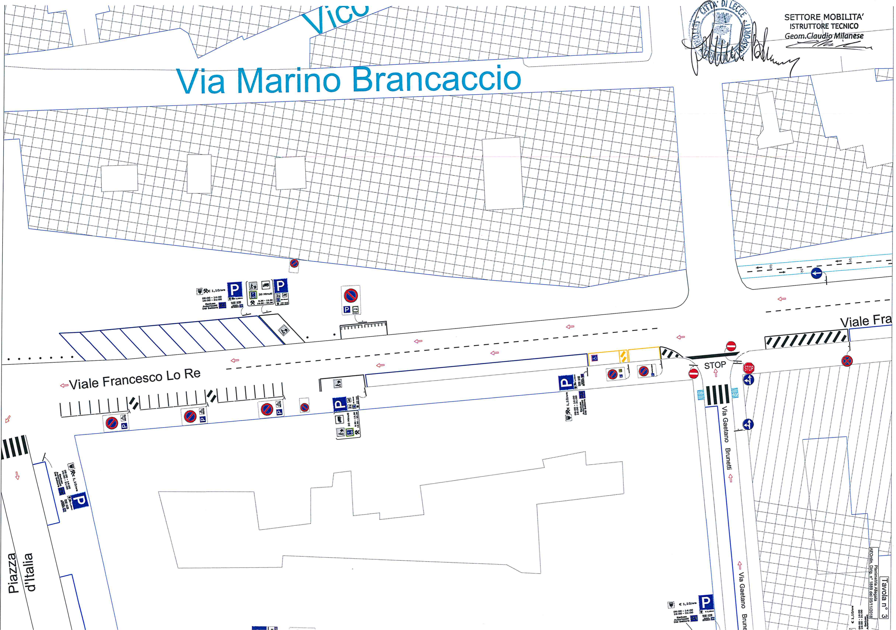
Tavola n° 3 Pianificata Allegata Altoordin. Dir. n° 1889 del 05/11/2018